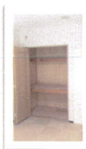
↑大型のクローゼットも全室完備！物が増えてもしまっておけます。