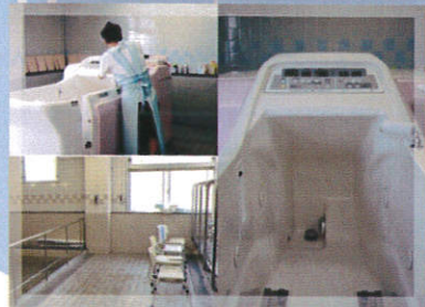
←機械浴槽も完備しております。安心してご入浴いただけます。