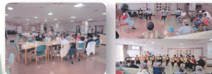
↑皆様でご飯を食べたり、ボランティアの踊りや歌を鑑賞したり、体操(自由参加)をいたします。

デイサービスを通して社会参加と交流の場をご提供し、心身機能の維持を図り、生活全体の質が向上するように援助いたします。